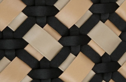
tissage de cuir