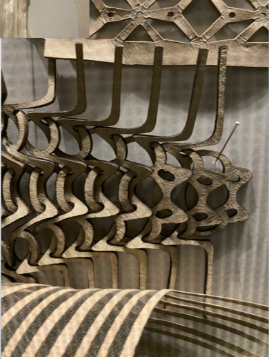
Iris Van Herpen - échantillonnages