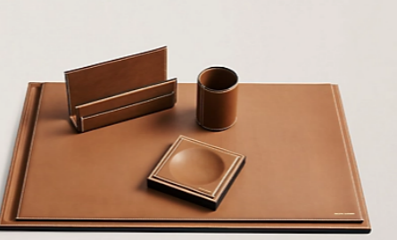
Ralph Laurent Home