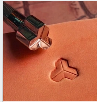
outil de gaufrage