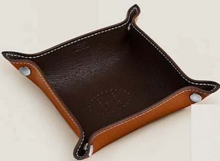
Hermès, Mini vide-poche Mises et Relances H Evelyne