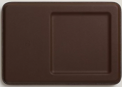
Hermès, Vide-poche chargeur sans-fil volt'H