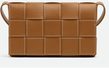
Bottega veneta, sac à bandoulière